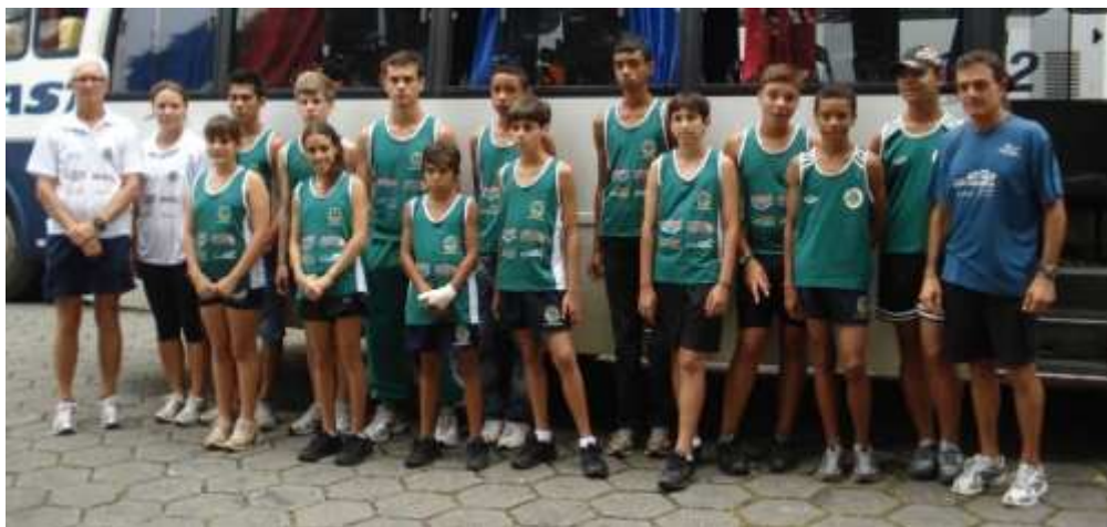
Equipe da Escolinha de Atletismo Corro à Pé

Proponho à Mesa, na forma regimental, depois de ouvido o Plenário, MOÇÃO DE APLAUSO aos técnicos e atletas da ‘ Escolinha de Atletismo Corro à Pé ’, na seguinte forma enunciada: