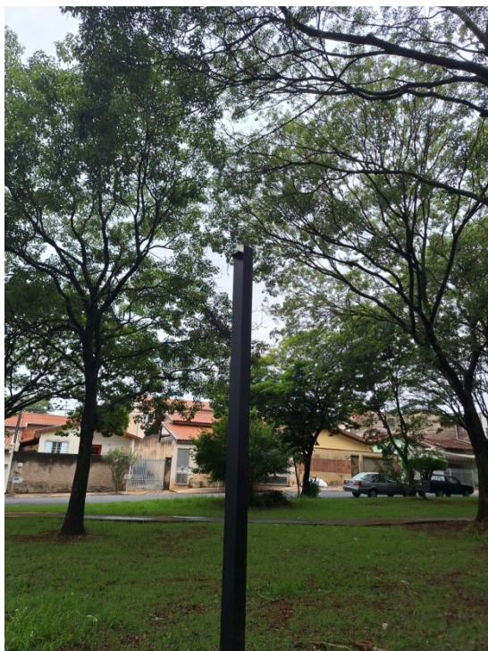
Postinhos sem as lâmpadas de LED