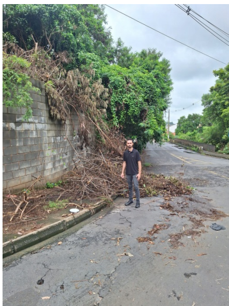
Rua Marechal Odélio Denys