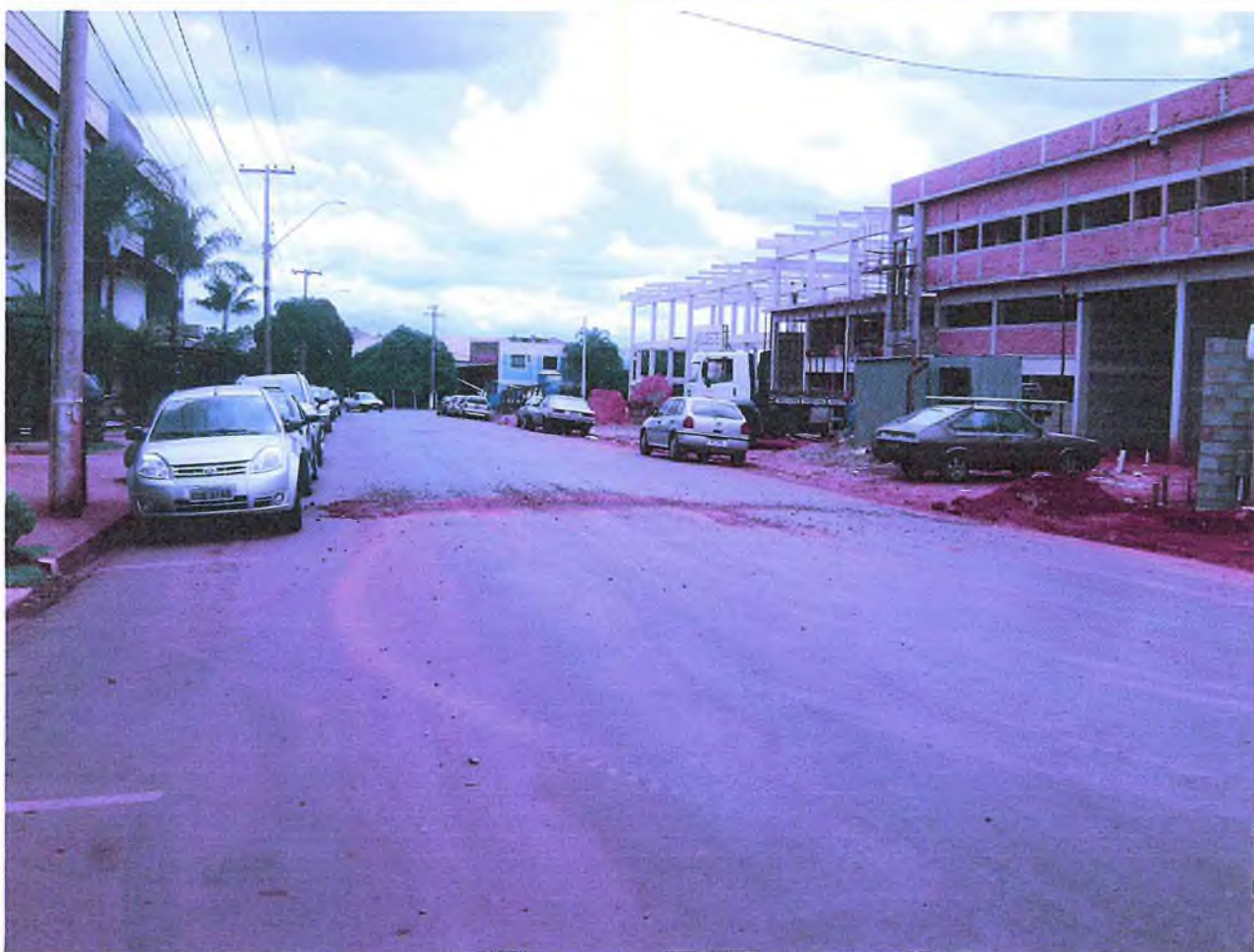
Rua Luiz Ometto, nºref. 215 – Dist. Industrial