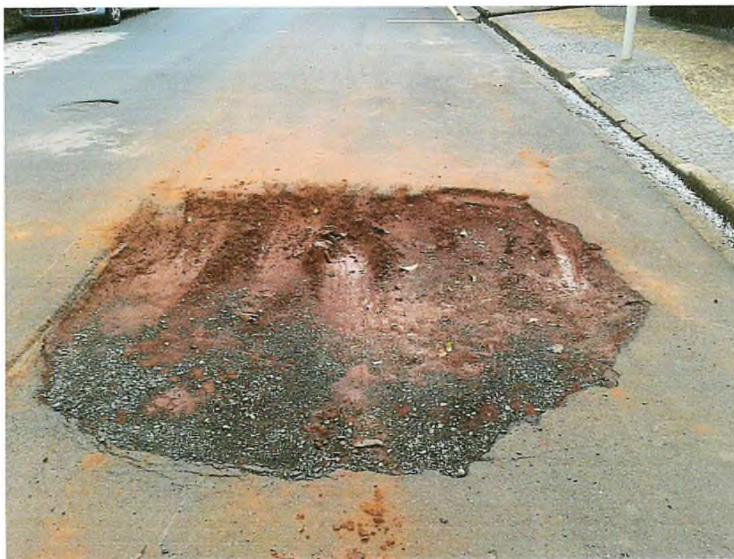
Rua Rio de Janeiro em frente ao nº 511 – Cidade Nova