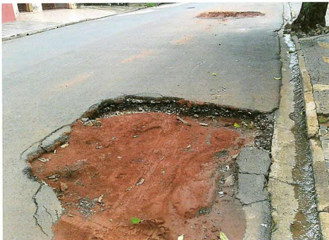
Rua Rio de Janeiro em frente ao nº 521 – Cidade Nova