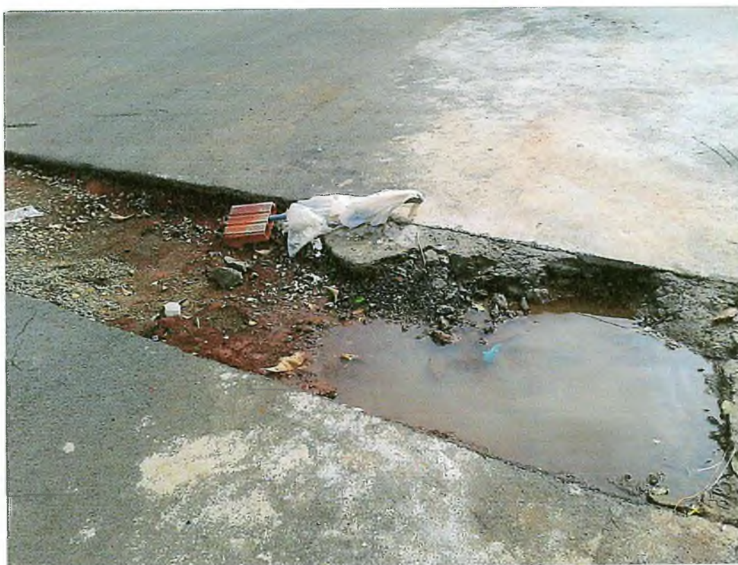
Rua Curitiba em frente ao nº 1231 – Jardim Esmeralda