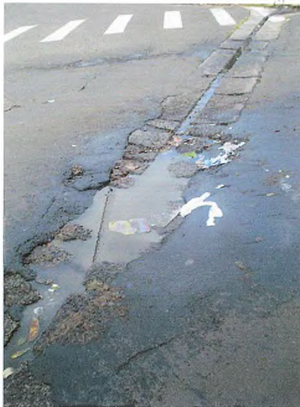
Canaleta que precisa ser refeita.