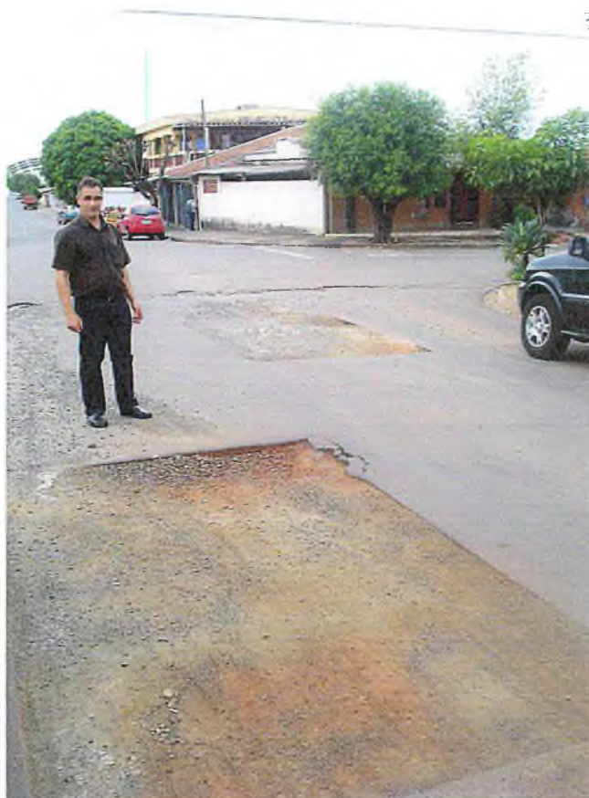
Buraco na Rua Ribeirão Preto, defronte n° 570.