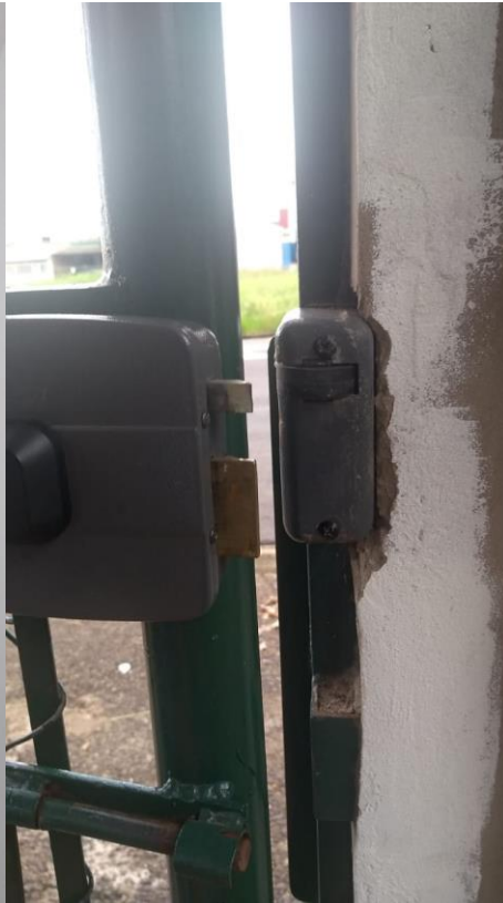
PORTÃO DE ENTRADA