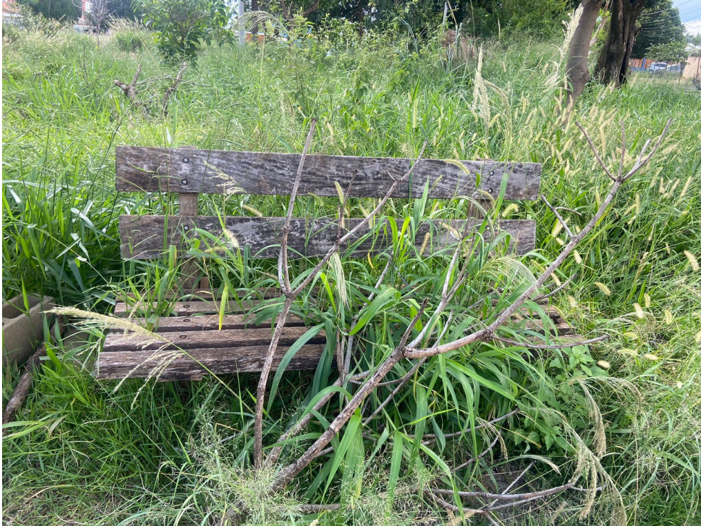
Mato na praça da Rua Vereador João Batista Machado, Rua Holanda defronte ao número 1.114, no Bairro Cândido Bertine 14/02/2023.