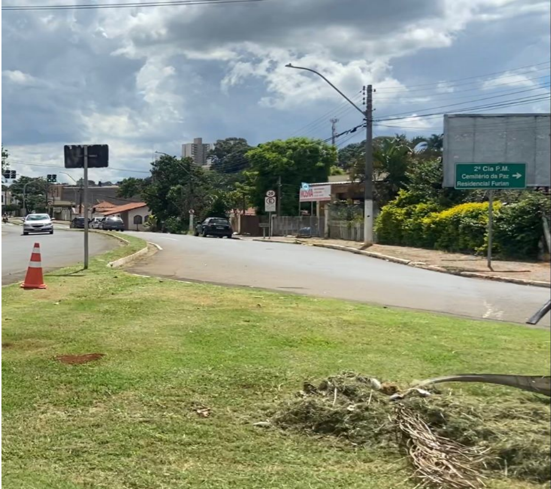
Roçagem da grama baixa na Avenida Tiradentes na região central 14/02/23.