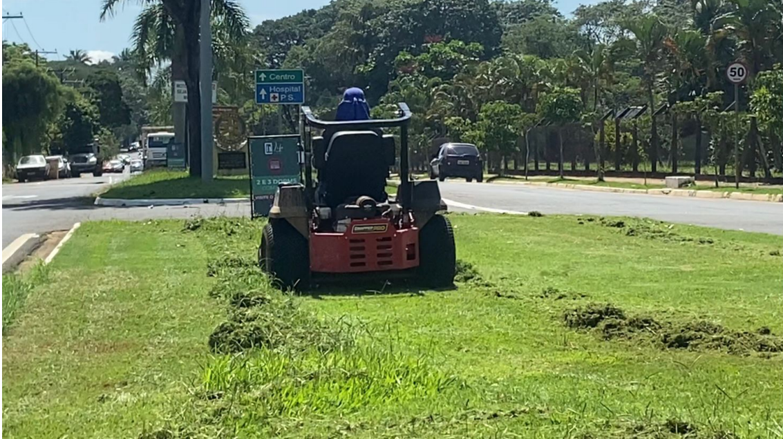
Roçagem da grama baixa na Avenida Monte Castelo na região central 15/02/23.