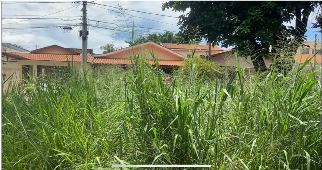
Mato na praça da Rua Vereador João Batista Machado, Rua Holanda defronte ao número 1.114, no Bairro Cândido Bertine 14/02/2023.