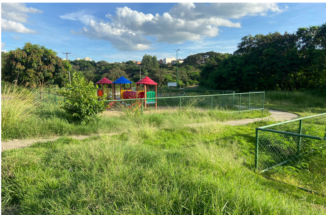
Parquinho e pista de caminhada na Rua Croácia, esquina com a Avenida Augusto Scomparim, no bairro Jardim Europa IV 16/02/23.