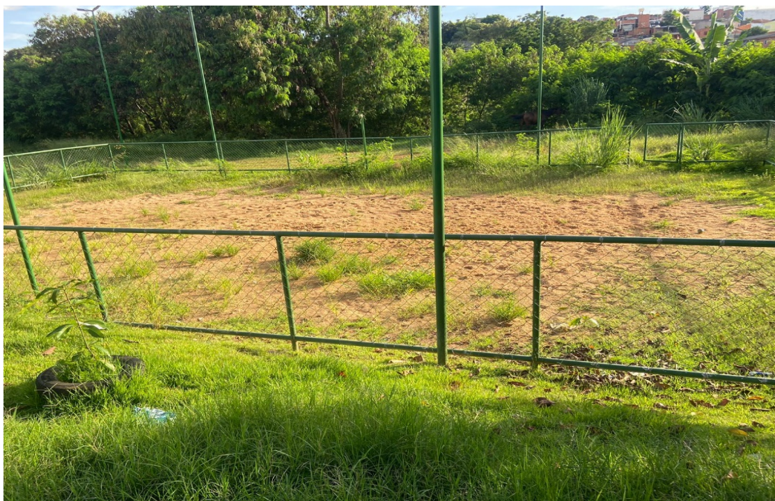
Campo de vôlei de areia na Rua Croácia, esquina com a Avenida Augusto Scomparim, no bairro Jardim Europa IV 16/02/23.