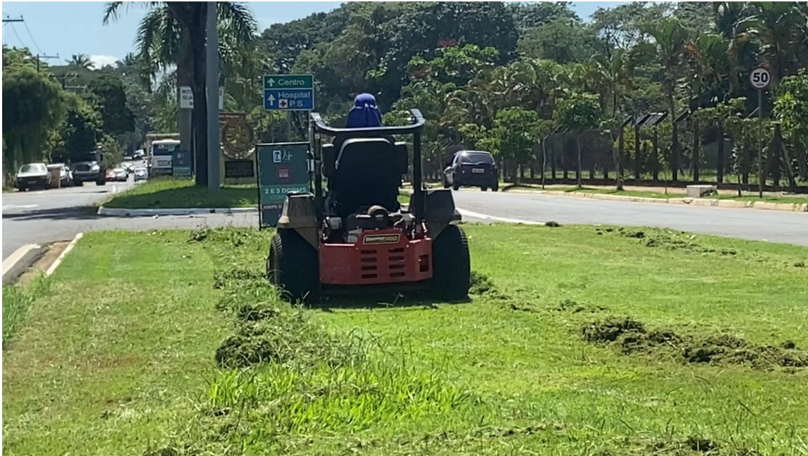
Roçagem da grama baixa na Avenida Monte Castelo na região central 15/02/23.