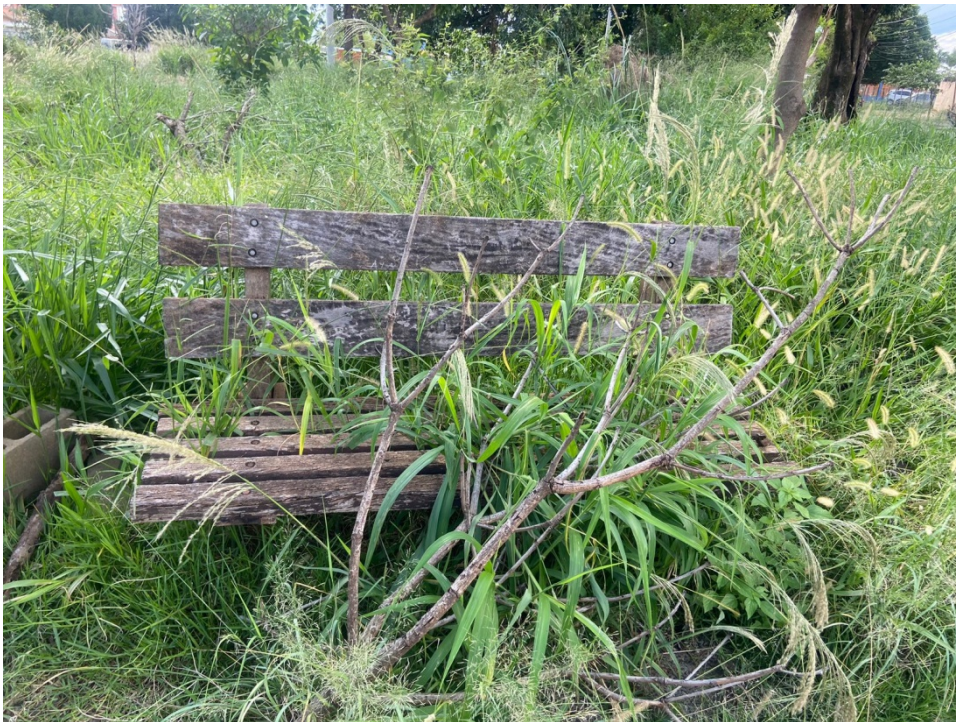
Mato na praça da Rua Vereador João Batista Machado, Rua Holanda defronte ao número 1.114, no Bairro Cândido Bertine 14/02/2023.