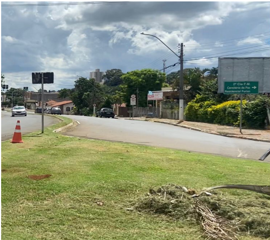
Roçagem da grama baixa na Avenida Tiradentes na região central 14/02/23.